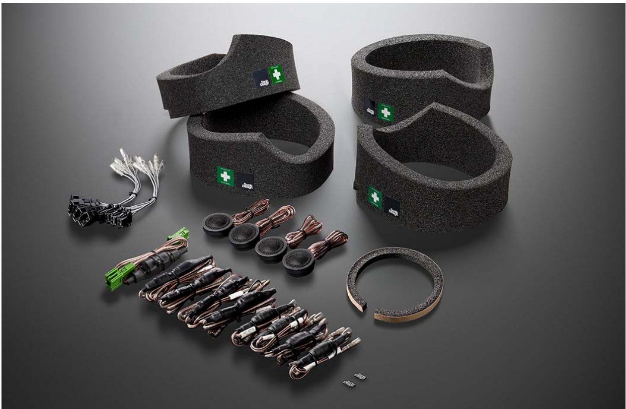
「Sonic Design Sound Suite」新款 EQB 车专用套装