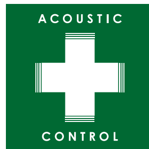
「アコースティックコントロール」 テクノロジーロゴマーク

「アコースティックコントロール」とは、これまで弊社が培ってきた音響解析・補正ノウハウによってオーディオシステムの再生環境を改善し、システム本来のポテンシャルを引き出して、より良い音を実現するためのテクノロジー&コンセプトの総称です。弊社では本製品を皮切りに、「アコースティックコントロール」を採用したカーオーディオ製品やアクセサリ類のラインアップを今後さらに拡充し、良い音で音楽を聴く楽しさを多くの皆様に提案してまいります。