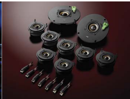
2C-222 Double Crest扬声器套装