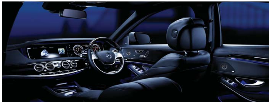
安装效果图（图片为合成图）