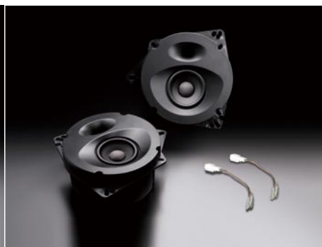
SP-861 (純正 2 スピーカー 装着車専用)