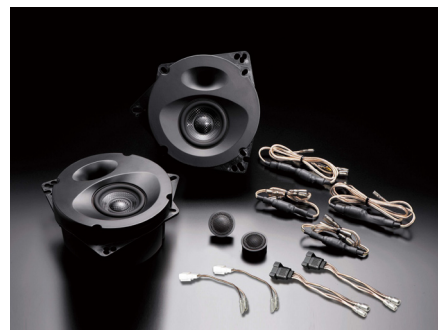
SP-862M スピーカーパッケージ

【製品に関するご注意】●本製品は音質最優先設計のため、純正リアスピーカーと比較して能率 (出力音圧レベル) がやや低めに設定されております。本製品を純正リアスピーカーと併用する場合は純正AVシステム側のフェーダーを使ってフロント/リアの音量バランスを再調整されることをお勧めします●本製品は純正・市販を含むあらゆるオーディオシステムで音質改善効果を実感していただけますが、その魅力を最大限に引き出すには高音質タイプのオーディオデッキやAVナビ、外部パワーアンプなどと組み合わせることが効果的です●ソニックデザイン製品認定販売店では、SonicPLUSの高音質をさらに引き立てるグレードアッププランも各種用意しております。これらのプランはSonicPLUSを装着した後にもご検討・ご注文いただくことができ、オーナーひとりひとりのご要望に沿った多彩なカスタマイズをお楽しみいただけます。詳しくはお近くのソニックデザイン製品認定販売店、または直接弊社へお訊ください。