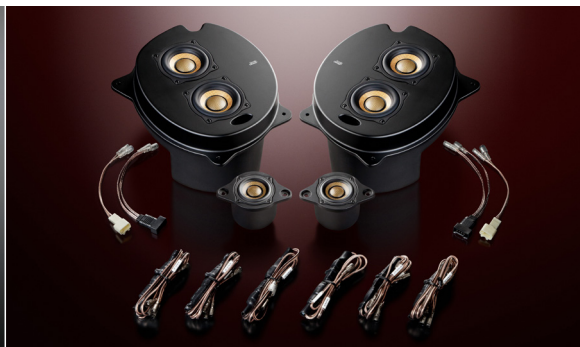
3C-P30 Triple Crest (ネットワーク付属)