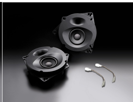
SP-N81E (フロント/リア両用)