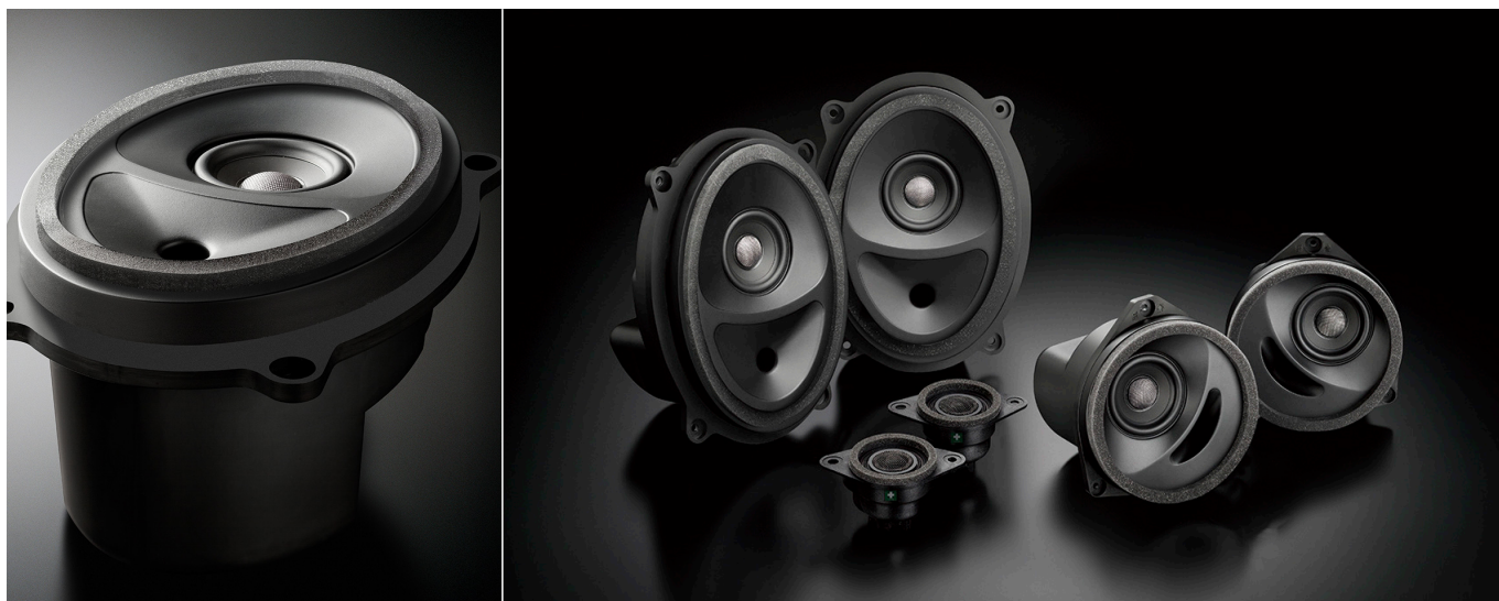
SFR-S03E(フロント+リアセット)

この製品には、ソニックデザイン独自の音響解析・補正ノウハウを結集してオーディオシステムの再生環境を改善するAcoustic Control(アコースティックコントロール)技術を採用*しています。 *トゥイーターモジュールハウジングに採用