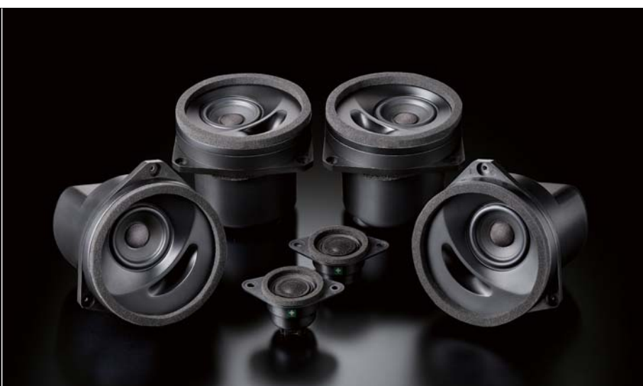
SX-L01E（前音场+后音场）扬声器