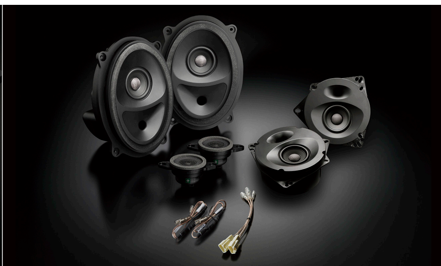
SFR-S04E(フロント+リアセット)