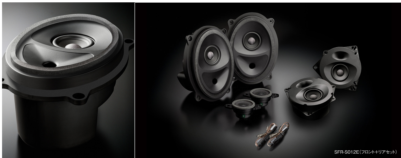
SFR-S012E(フロント+リアセット)

SR-S012E スピーカーパッケージ リア専用単品 推奨取付時間:1.0H(リアのみ)