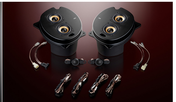
1C-P30 Single Crest (ネットワーク付属)