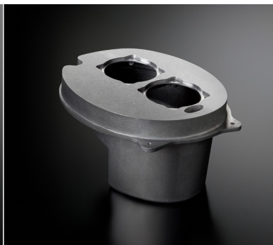
ソノキャスト ARMS エンクロージャ