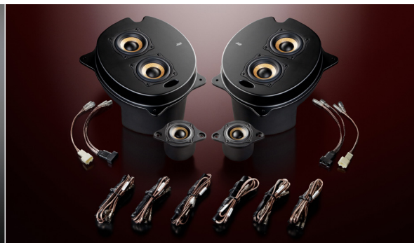
2C-P30 Double Crest (ネットワーク付属)