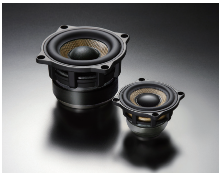
SD-N77R 型 (左) と SD-N52R 型 (右)