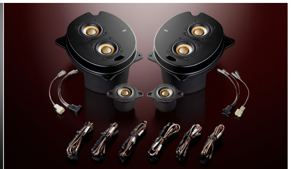
3C-P30 Triple Crest (ネットワーク付属)