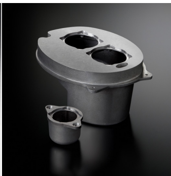
ソノキャスト ARMS エンクロージャ