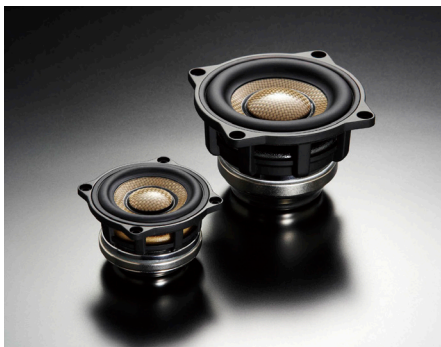
SD-N52N 型 (左) と SD-N77N 型 (右)

3C-P30L Triple Crest スピーカーパッケージ 零售价：1,380,000円 (セット/税込) 取付費別 受注生産品 ネットワークレス仕様