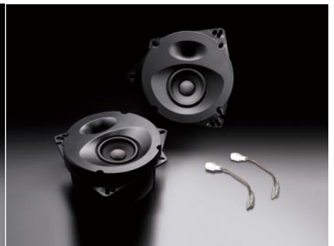
SP-861 (純正 2 スピーカー 装着車 専用)