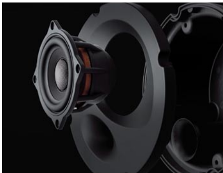
エンクロージャ一体型ウーファーモジュール