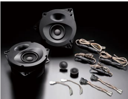
SP-862 (純正 6 スピーカー 装着車 ・ フロント 専用)