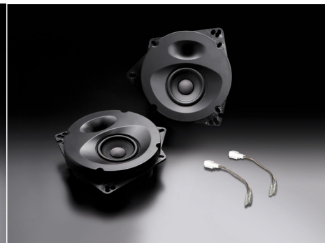
SP-N81E (フロント/リア両用)