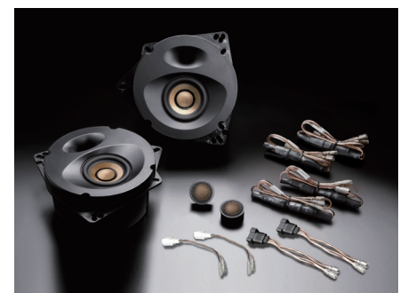
SP-C21F スピーカーパッケージ

●トヨタ カローラ スポーツ(210系)各年式のフロント交換専用。 *スピーカーと車両とのイラスト上の縮尺比は実際と異なります。