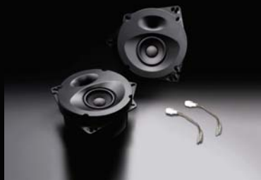
SP-ES81E 后置扬声器套装 零售价4,580元，不含安装费