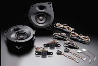
SP-CR21Ecn 前置扬声器套装 零售价7,330元，不含安装费

SonicPLUS丰田皇冠扬声器套装，无需多余加工的无损安装方法，漏音浊音一扫光的尖端技术，让清澈剔透的声音与您一路相随！