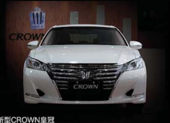
新型CROWN皇冠 预计安装时间：前置2小时；前置+后置3小时 小贴士：仅限于6扬声器装载车