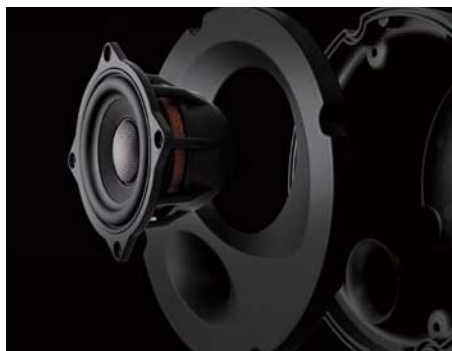
密闭一体式低音单元