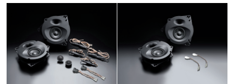
SP-AQUA2M スピーカーパッケージ(写真左)

●特殊樹脂製バックチャンバー 振動モードの異なる特殊樹脂製バックチャンバーとアルミダイキャスト製バッフルとを強固に締結し、高気密で不要共振を排除した理想のエンクロージャが完成。ユニット背面を湿気や走行中の気圧変化から守り、良い音を長くお楽しみいただける抜群の耐久性も実現しています。